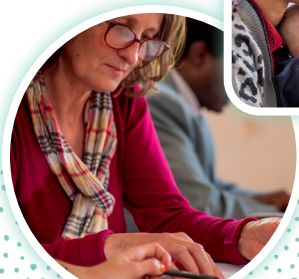
Emploi et insertion