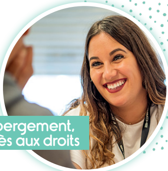
Hébergement, accès aux droits