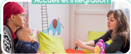
Accueil et intégration